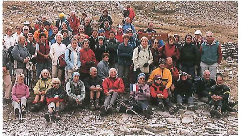
C'est ça, l'Europe des randonneurs...

Enfin, il faut bien se séparer. Chacun repart de son côté jusqu'à l'année prochaine.